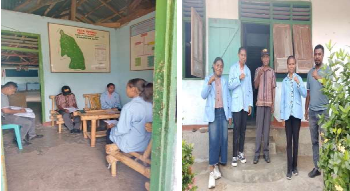
Gambar 1 : Dokumentasi Bersama Kepala Desa Dan Sekertaris Desa Morba

Perkebunan merupakan salah satu subsektor pertanian yang memainkan peranan penting dalam pembangunan nasional. Dalam Undang-Undang dasar no 18, 2004(Pasal 4) tentang perkebunan, subsektor perkebunan berfungsi meningkatkan kemakmuran dan kesejahteraan rakyat. DataBPS Nasional, 2014menunjukkan bahwa luas areal perkebunan mencapai 23.969 juta hektar, yang terdiri atas perkebunan rakyat 16.794 juta hektar (70,06%) dan perkebunan besar 7.175 juta hektar (29,93%). Sektor pertanian khususnya subsektor perkebunan merupakan salah satu subsektor yang memberikan sumbangan yang besar dalam peningkatan devisa, penyerapan tenaga kerja, peningkatan pendapatan petani dalam kegiatan perekonomian dan pengembangan wilayah., (Helmi et al., 2021).