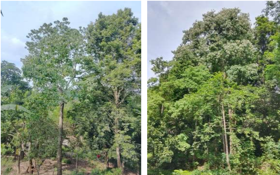
Gambar 2: Perkebunan Kemiri

Pengembangan perkebunan kemiri di Desa Morba mengalami peningkatan cukup signifikan dalam beberapa tahun terakhir. Berdasarkan hasil wawancara dengan narasumber, Setaip tahun terdapat lahan baru dimana warga kebanyakan membuat lahan baru di area lereng yang rimba dan menanami phon kemiri. Hal ini menjadikan penghasilan kemiri dari tahun ke tahun meningkat. Luas lahan kemiri saat ini kurang lebih seluasr 20 hektar. Jumlah produksi kemiri dari tahun ke tahun pun mengalami peningkatan. Bapa kepala desa mengatakan bahwa meskipun hasil produksi beberapa tahun belakangan ini tidak menentu, namun hasil panen tahun ini mengalami peningkatan dalam jumlah produksinya.